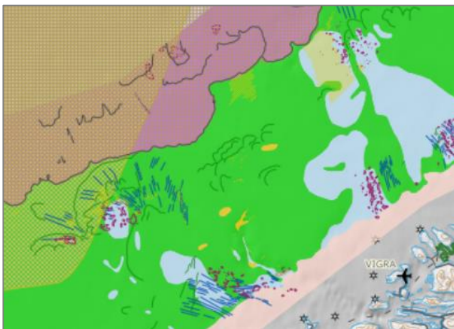
Kartinnsyn med flere tema.

Datasettet viser bunnsedimenter i havbunnens øvre del (øverste 0-3 m av sjøbunnen), klassifisert etter jordartstype.