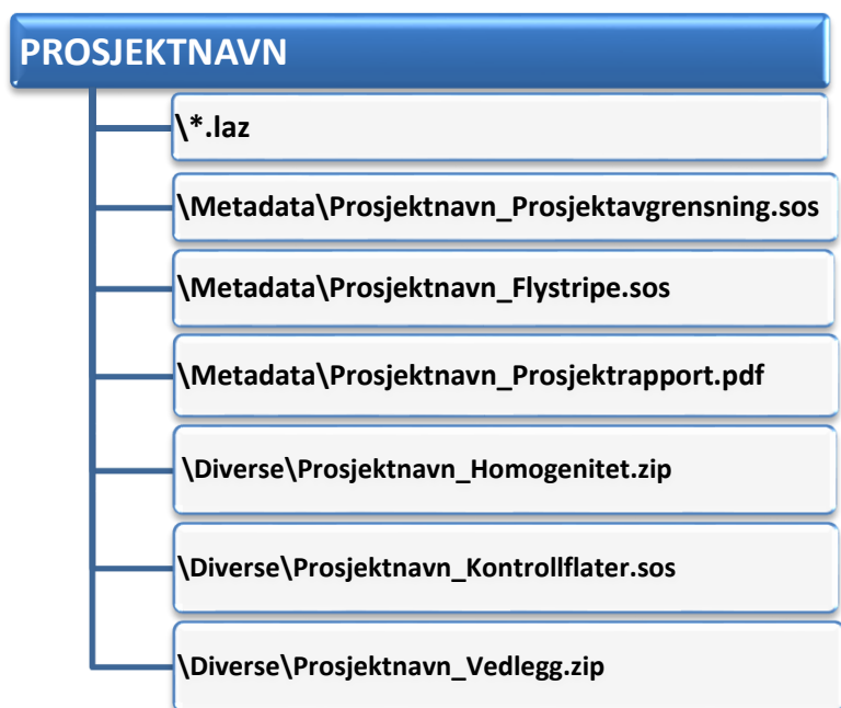
Figur 5 Struktur for leveranse av data fra laserskanning

Leveransen skal følge katalogstrukturen vist i figur 5.