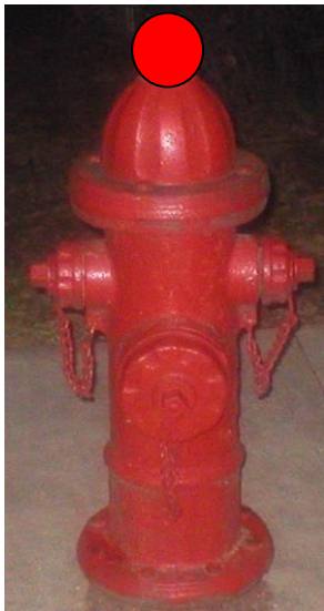
Figur 1: Eksempel på registrering av VA_Hydrant (rød prikk).