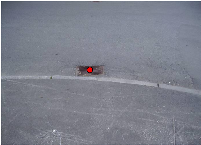
Figur 3: Eksempel på registrering av VA_Sluk (rød prikk).